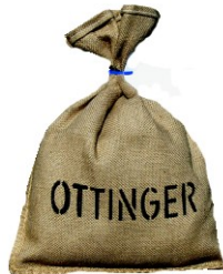
1 Paar im Jutesack