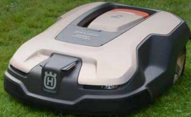
In diesem Garten in Seewen SZ mäht seit Herbst 2020 ein Automower® 315X Limited Edition.

25 Jahre Entwicklung, Ingenieurskunst und Innovation. Wir sind stolz, das automatische Mähen revolutioniert zu haben und nach einem Vierteljahrhundert die Nummer 1 weltweit und Innovationsleader für automatisches Mähen zu sein. Ganz besonders freut uns, dass die Schweiz die höchste Roboterdichte weltweit ausweist und Husqvarna mit seinem Automower® in unserem Land Entwicklungsgeschichte geschrieben hat.